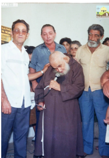
Quicuncá / Farias Brito-CE