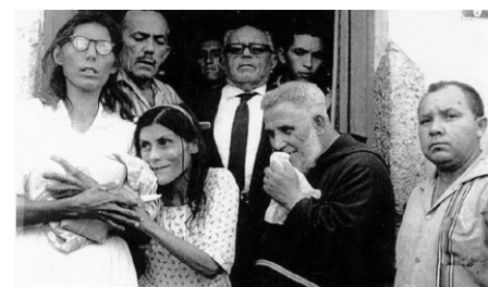
Lavras da Mangabeira-CE