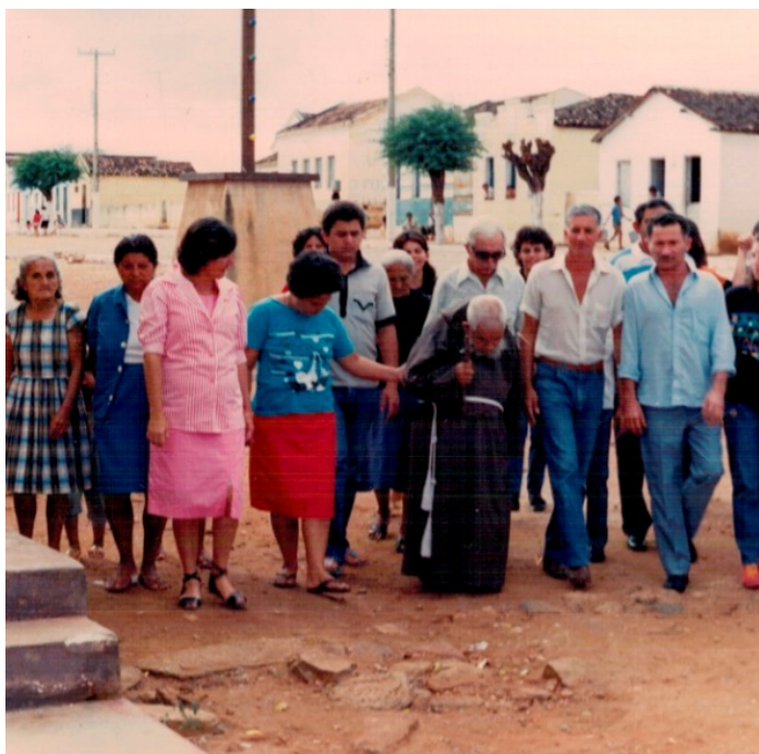
Barra de São Miguel-PB